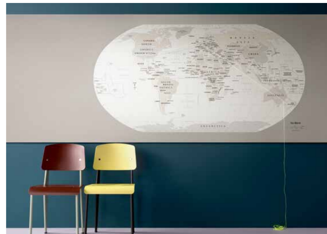
2182 | potato skin 3363 | walton lilac

BULLETIN BOARD leveres i ruller på op til 28 meter og har en bredde på 1,22 meter, det gør produktet egnet til større monteringer i for eksempel konferencelokaler og på vægge i gangarealer.