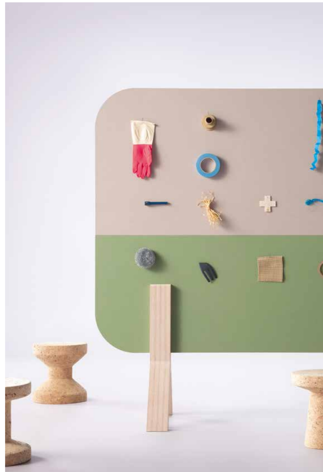
2187 | brown rice 2213 | baby lettuce 3363 | walton lilac

BULLETIN BOARD giver ideelle løsninger til det moderne bæredygtige kontormiljø, hvor skillevægge eller møbelementer kan bruges til at udveksle og samle information.