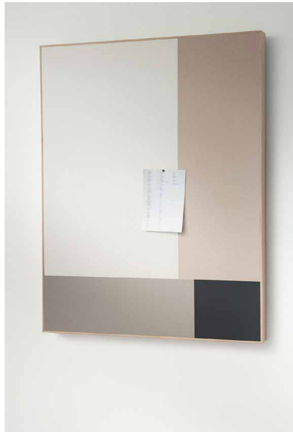
2182 | potato skin 2187 | brown rice 2206 | oyster shell 2209 | black olive

Bulletin Board kan fås indrammet i ensfarvet efter behov, eller i dekorative kombinationer som understøtter indretningen. Alle forskellige størrelser er ideelle til, at du kan udveksle tanker eller til at udstille din kreativitet.