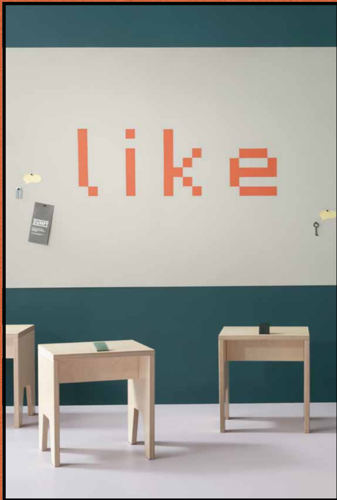
2206 | oyster shell 2211 | tangerine zest 3363 | walton lilac