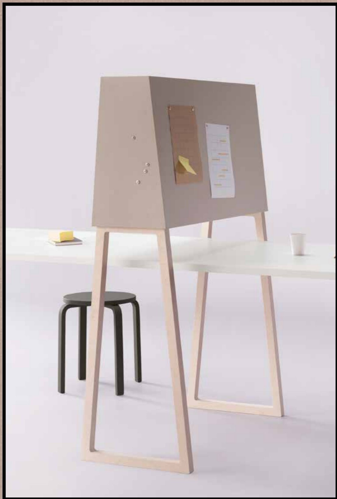
2187 | brown rice 3363 | walton lilac