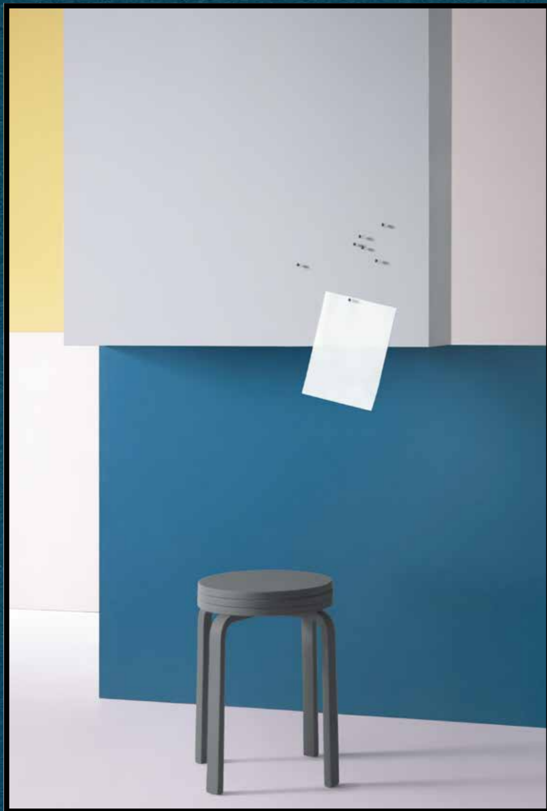
2162 | duck egg 2186 | blanded almond 2214 | blue berry 3363 | walton lilac