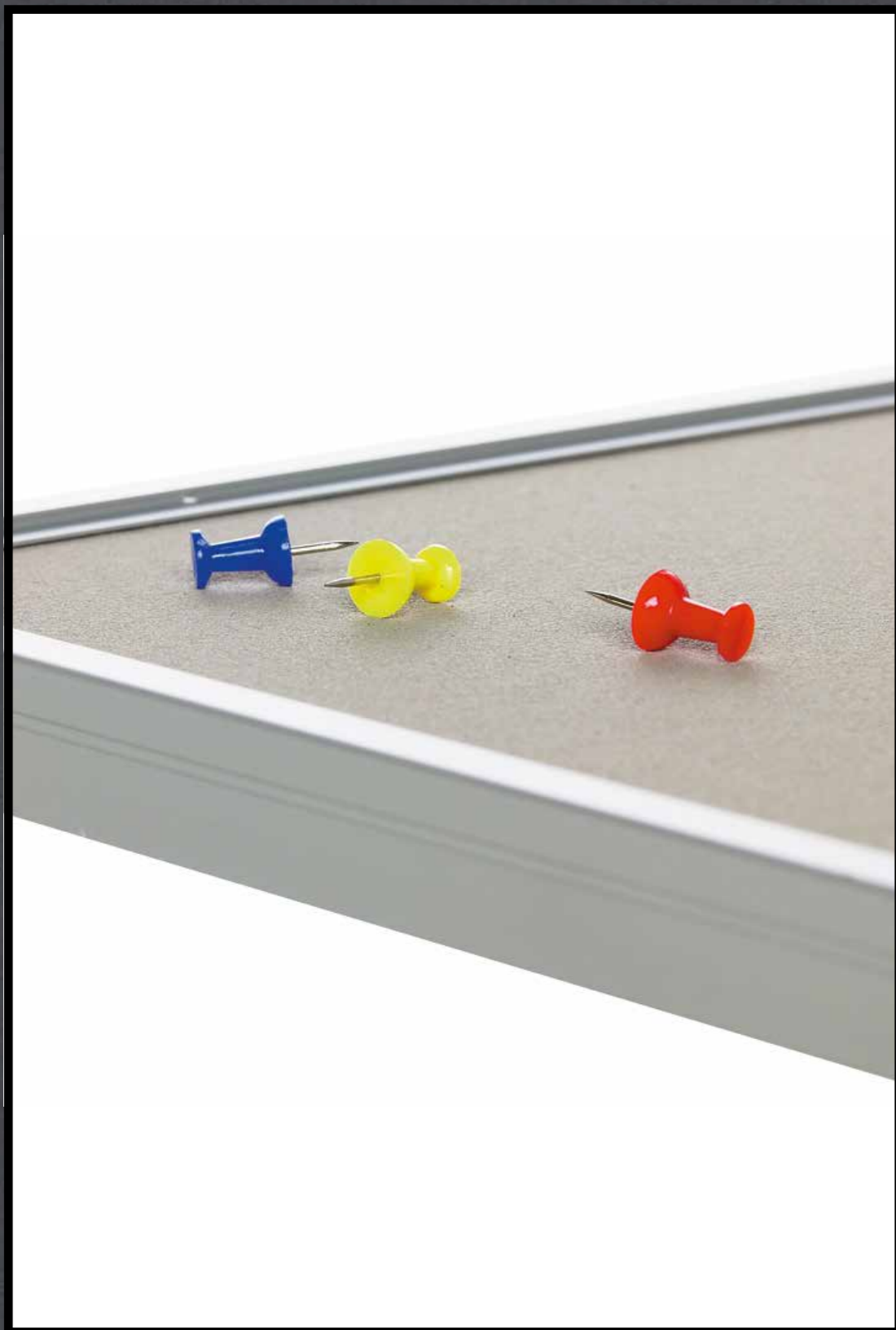
2187 | brown rice