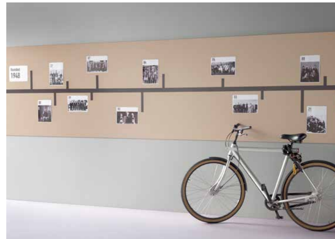
2186 | blanded almond 3363 | walton lilac