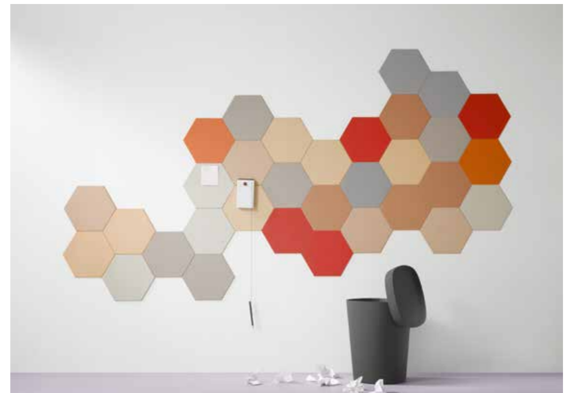
2210, 2207, 2166, 2162, 2206, 2182, 2187, 2186, 3363 | walton lilac

BULLETIN BOARD er fleksibelt og nemt at skære og håndtere, og giver dig mulighed for at designe nogle kreative vægdekorationer. FRAMED SOLUTIONS